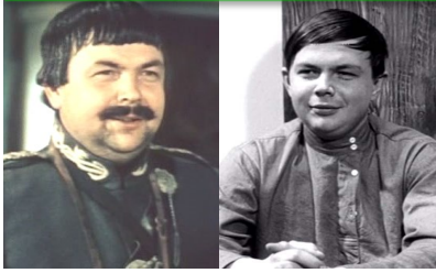
Хорунжий Попов из фильма «Эскадрон гусар летучих»