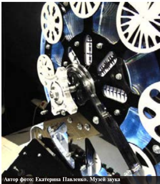
Автор фото: Екатерина Павленко. Музей звука