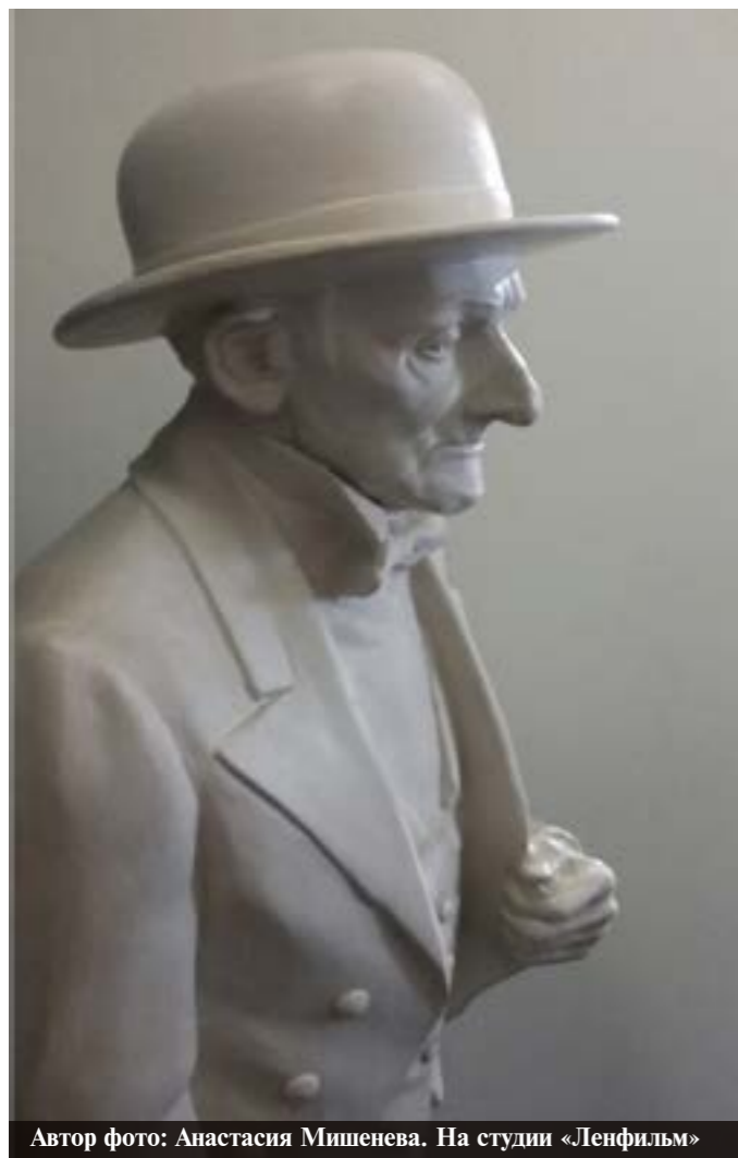
Автор фото: Анастасия Мишенева. На студии «Ленфильм»

Главный редактор Вера Щепкина Николай Русанов Шеф-редактор Александр Панин Верстка Елена Сушинина